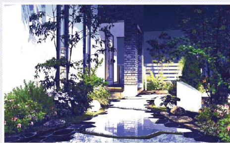
図定 [SPファインダー-09-SPパレット+植付] (トープ)